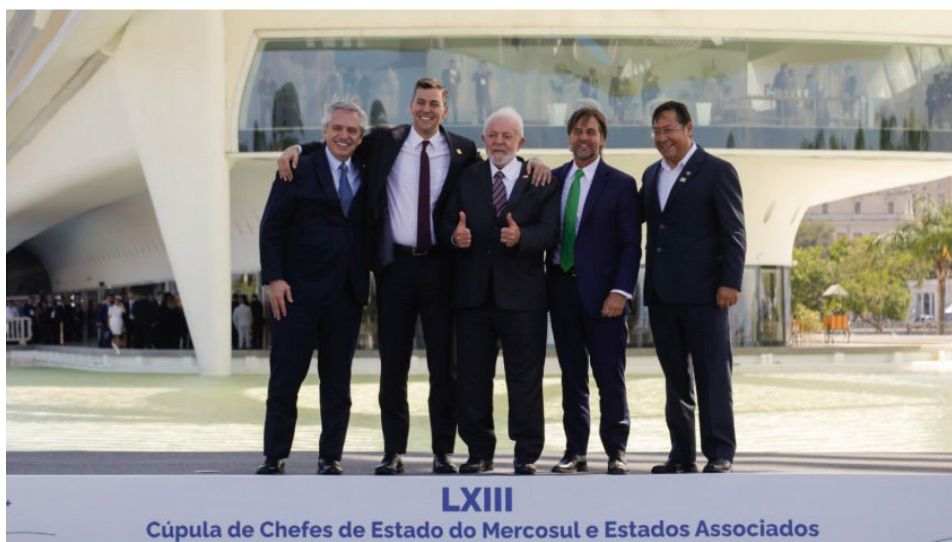
Da esquerda para a direita, os presidentes Alberto Fernández (Argentina), Santiago Peña (Paraguai), Lula (Brasil), Luis Alberto Lacalle Pou (Uruguai) e Luis Arce (Bolívia)

Disponível em: https://www.poder360.com.br/poder-flash/mercopol-realiza-foto-oficial-da-63a-cupula-do-bloco/ . Acesso em: 10 dez. 2023