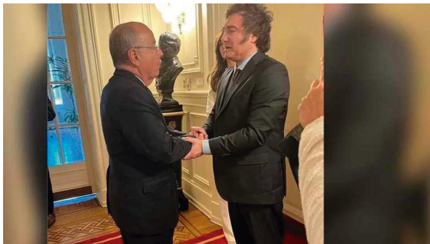
Chanceler Mauro Vieira cumprimenta o novo presidente argentino Javier Milei